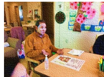
男性もパックしました