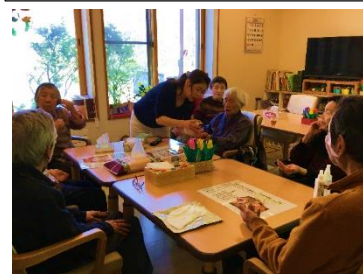
皆で顔ツルツルになりました