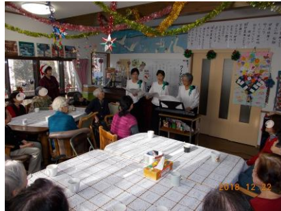
素敵なお歌声に一同感激です