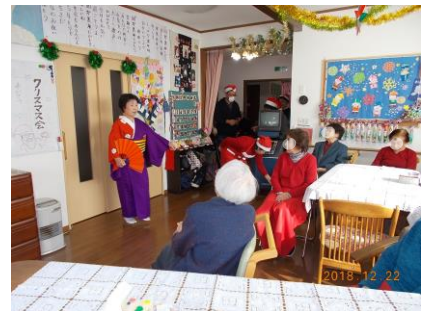
艶やかな舞いに釘づけでした