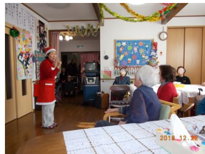
鬼のパンツ体操楽しかったですね