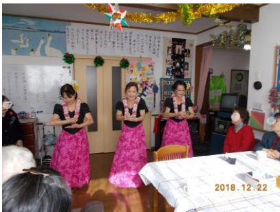
優しい音色に癒されました