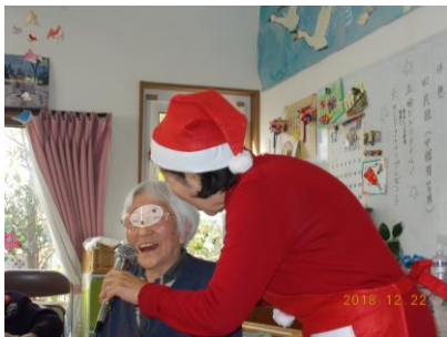
利用者代表で歌のご披露です