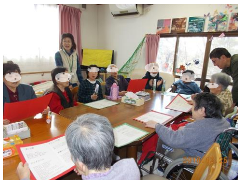
杜っこの子供達とクリスマス♪