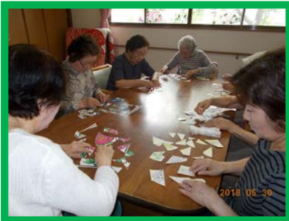
「認知パズル」を手作り