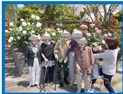
ご近所の「薔薇園」にて