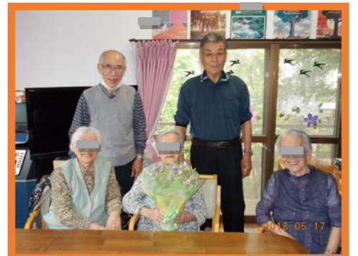
ボランティアさんとお誕生祝