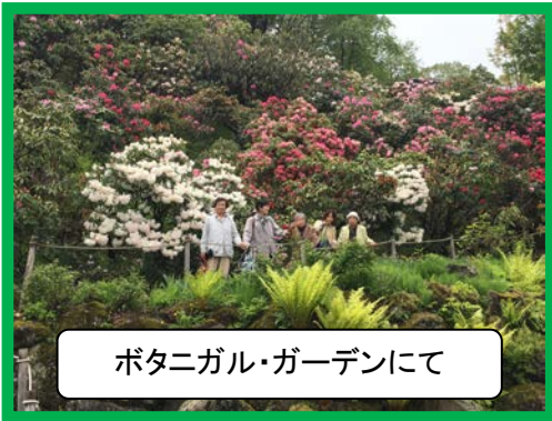
ポタニガル・ガーデンにて