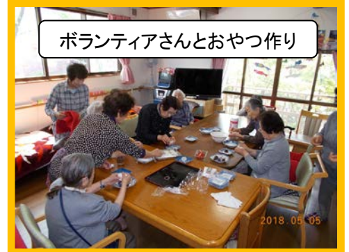
ボランティアさんとおやつ作り