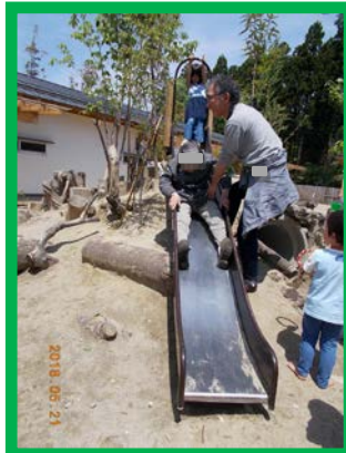
ああ懐かしや すべり台