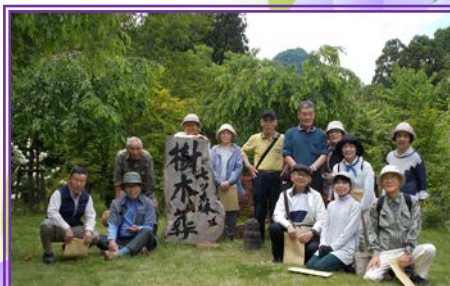
「七ツ森周辺と樹木葬の現地を散策」