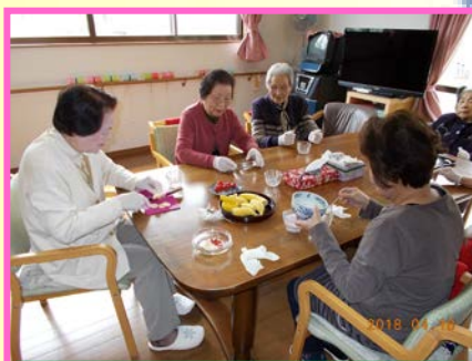
手作りおやつ ヨーグルトとフルーツで