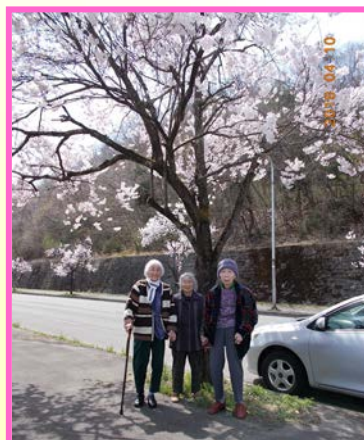
桜と私たちどっちがきれい？