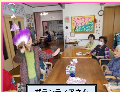
ボランティアさん に舞のご披露