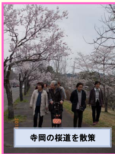
寺岡の桜道を散策