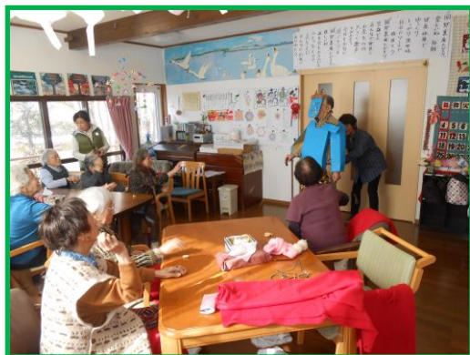
本気で落花生をぶつけています