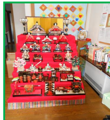
囲炉裏庵のひな飾りです