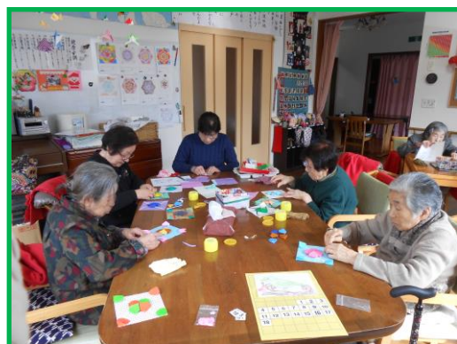
四つ葉のクローバーを作っています