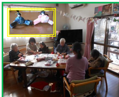
ひな人形を作っています