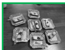
手作りガトーショコラ!!なぜか白黒