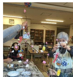
小正月の準備風景

ミズキに餅のだんごをさし、だるまや小判も飾りました。女正月とも言い、お正月に忙しく働いた女性のお休みの日でもあると教えていただきました。