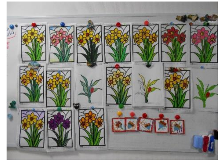
2月のカレンダー用塗り絵