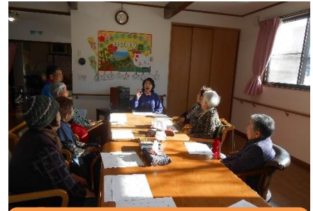
民謡を歌う、まず発声から