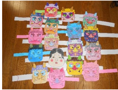
小羊園の子供達にプレゼント