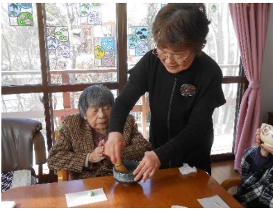
新春、お茶を楽しむ会