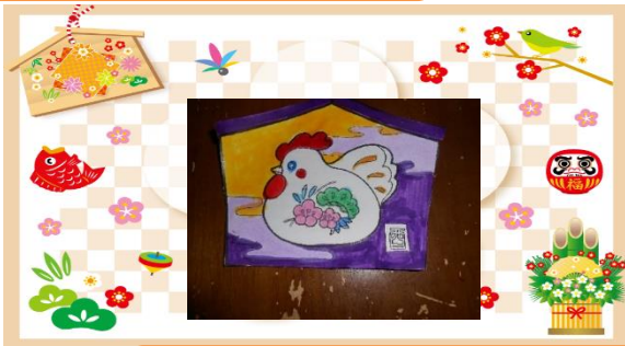
今年の願い事を絵馬に書きました