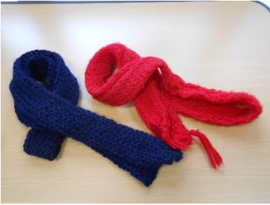
マフラーを編みました