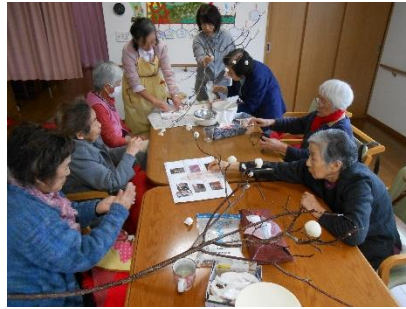
小正月の団子飾り